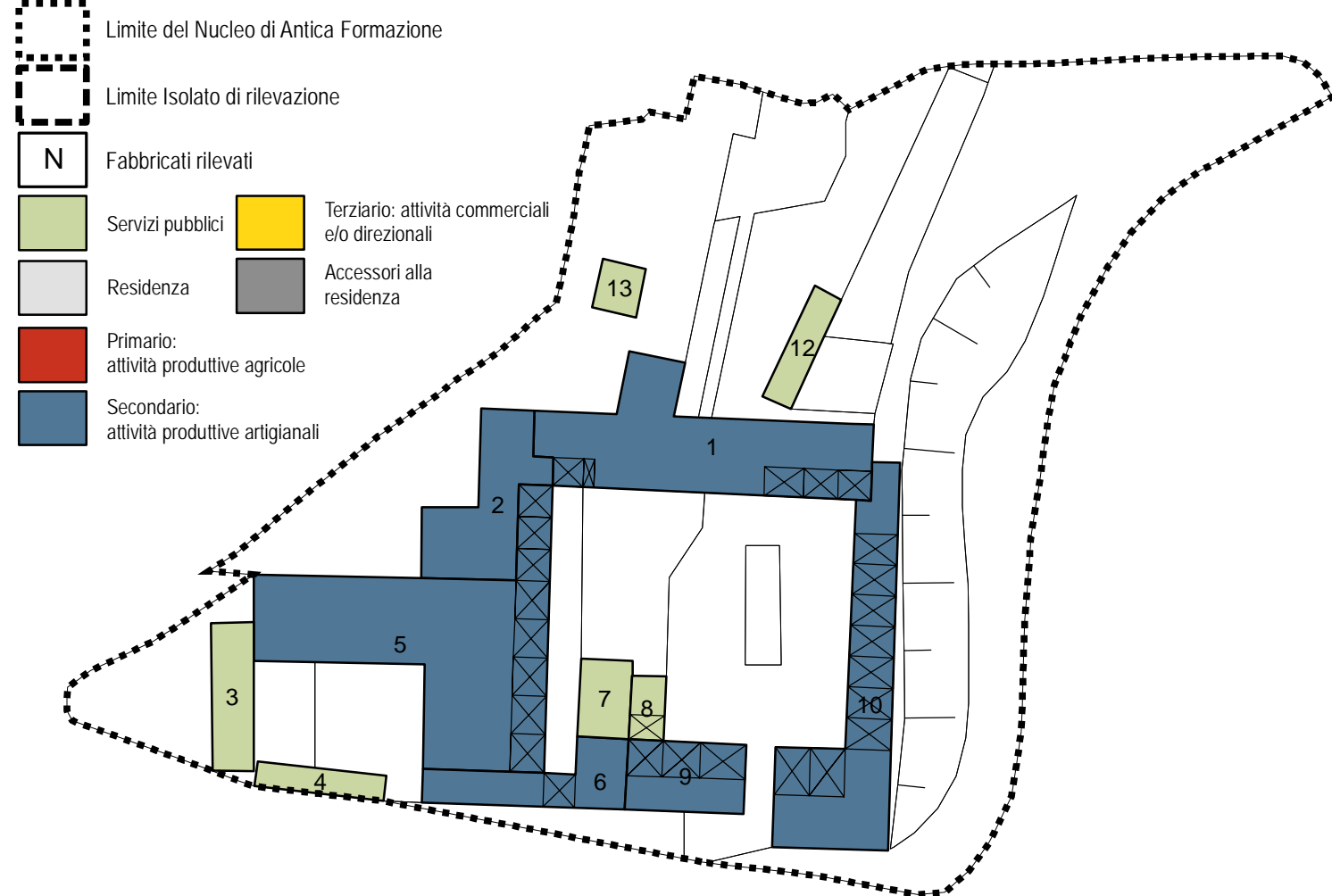
GRADI DI OPERATIVITA' E PREVISIONI PARTICOLARI