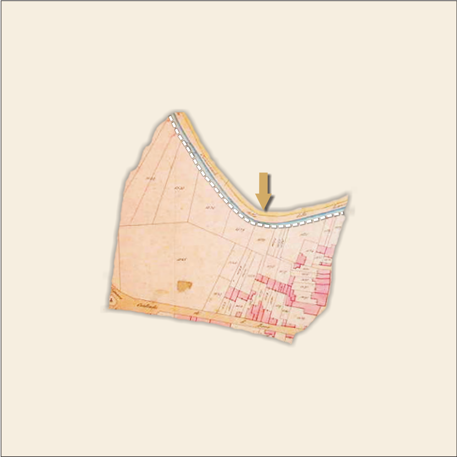
Catasto storico del 1853, scala 1:2.000