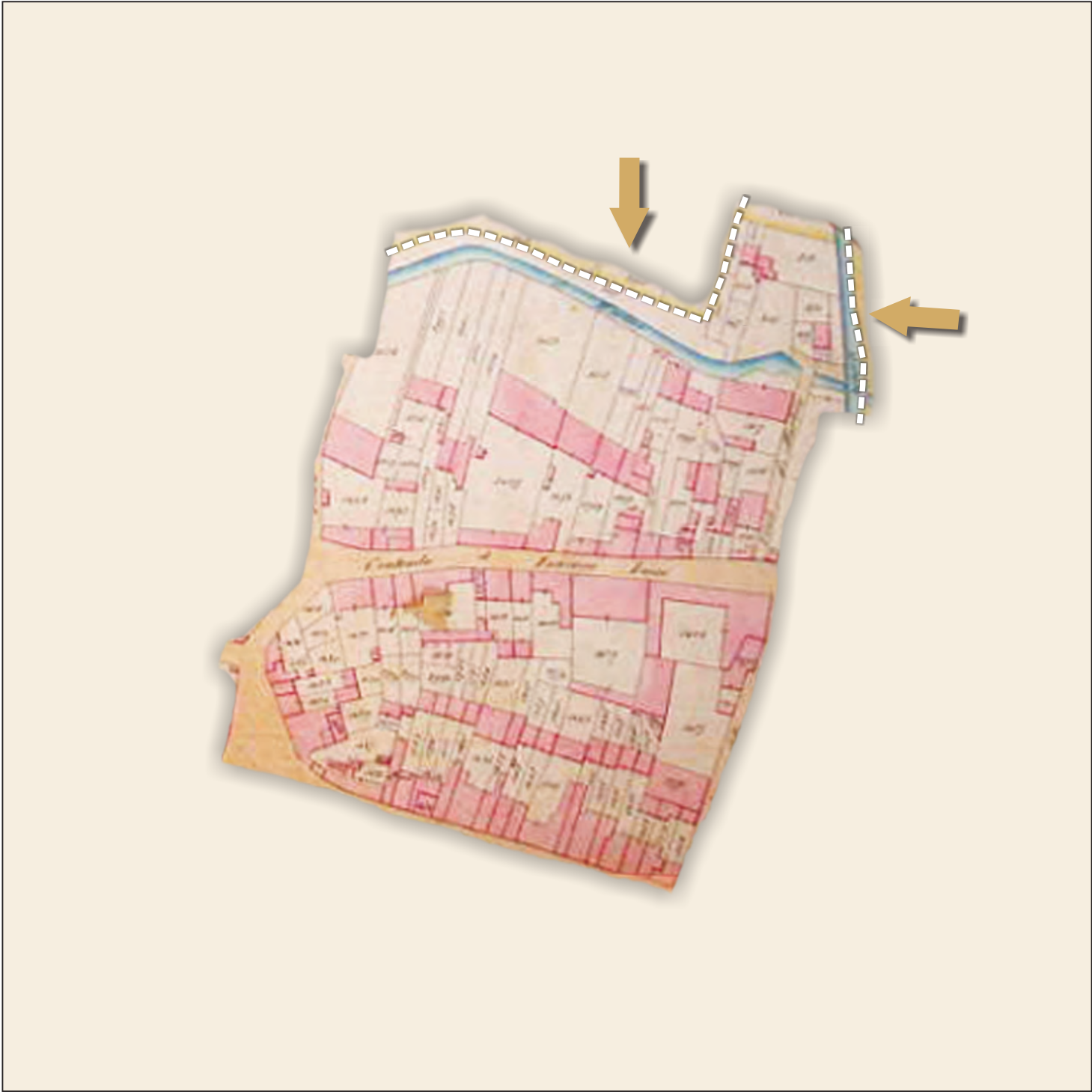
Catasto storico del 1853, scala 1:2.000