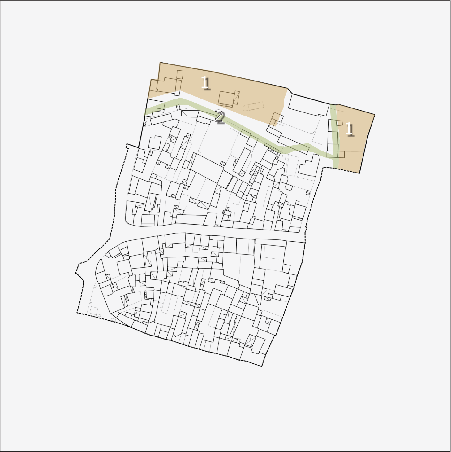
Isolato di rilevazione n. 4 (aerofotogrammetrico), scala 1:2.000

1: Gli areali ricompresi negli ambiti evidenziati al numero 1 vengono proposti per l'inserimento nel perimetro del nucleo antico in quanto, ineditati all'epoca della stesura del catasto storico di riferimento, risultano, alla data d'adozione della presente relazione, occupati da fabbricati privi di valore storico-ambientale e formale ma tuttavia efficaci a definire il filtro tra il limite del nucleo storico limitrofo e il tessuto urbano moderno adiacente.