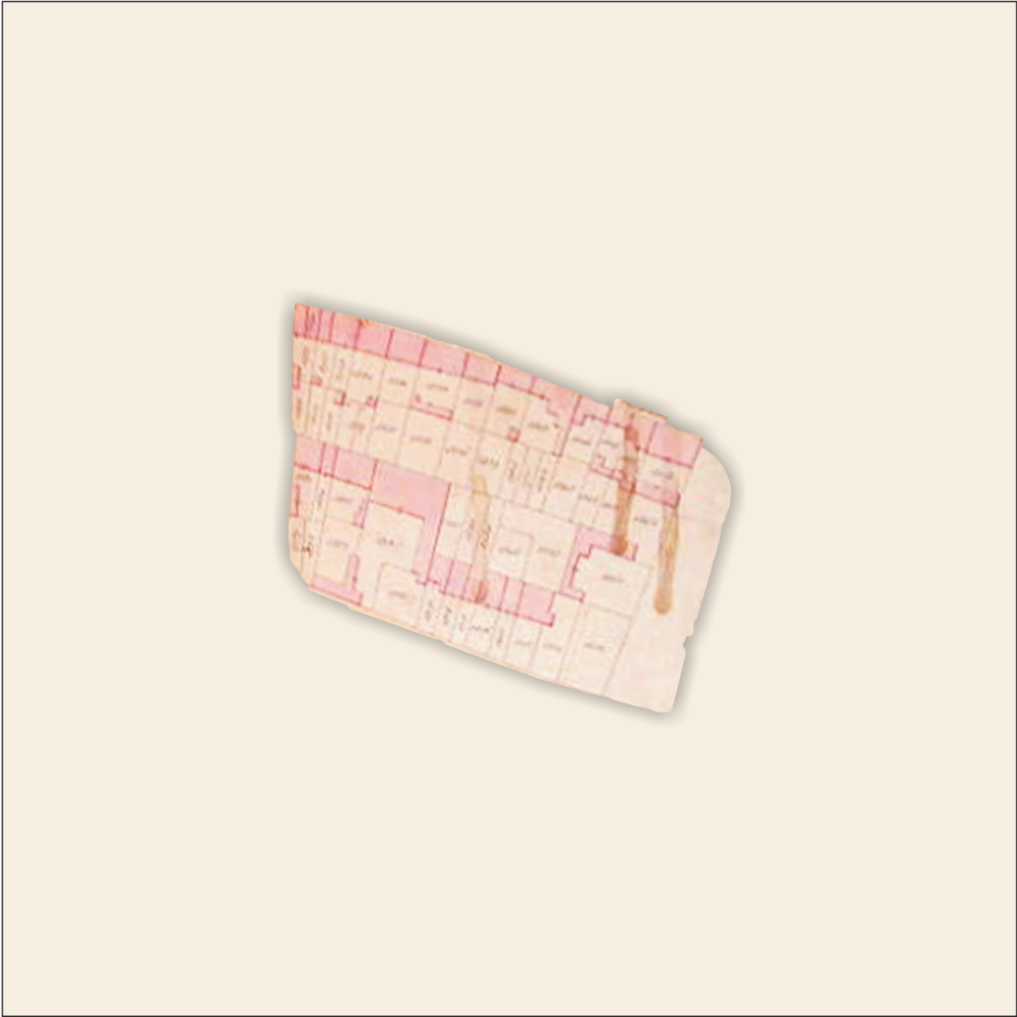
Catasto storico del 1853, scala 1:2.000