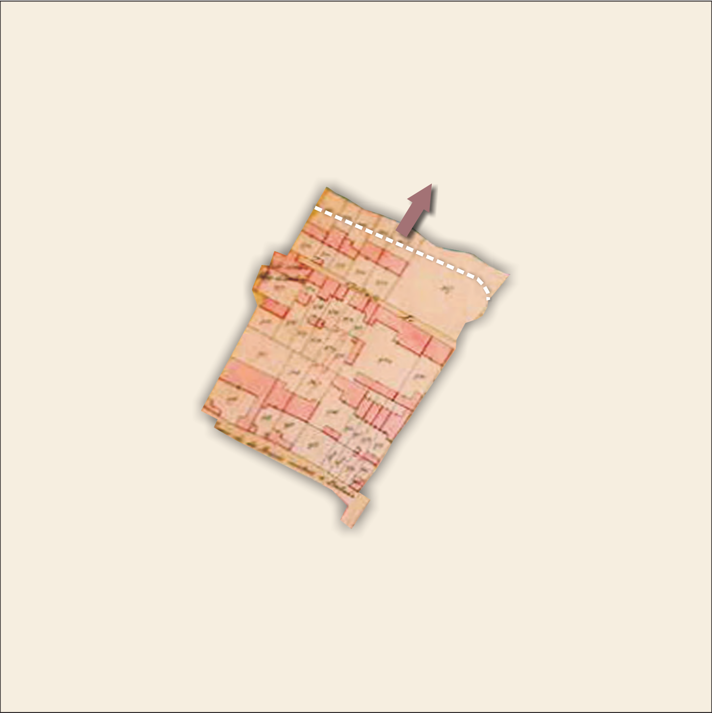
Catasto storico del 1853, scala 1:2.000