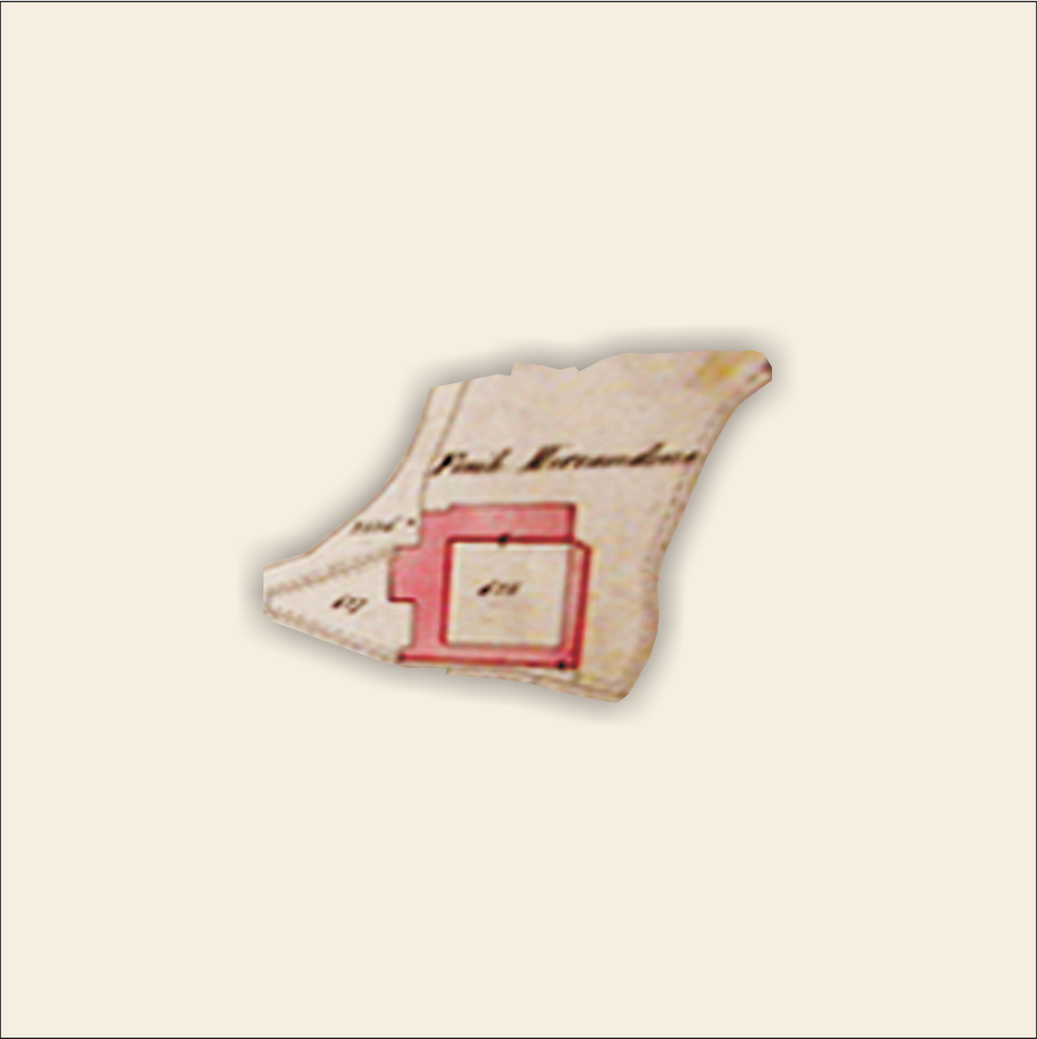
Catasto storico del 1853: dettaglio dei nuclei frazionali, scala 1:2.000